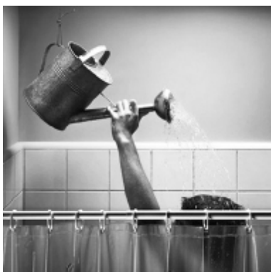
Не пришлось бы мыться так...

К этим и остальным неплательщикам коммунальное предприятие применяет различные санкции: обращение в суд, начисление неустойки, размеще-